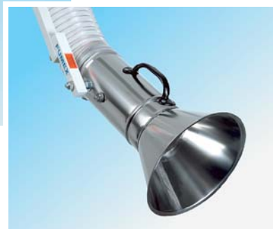
Absaugdüse und Haube aus Edelstahl

Die Fumex Produktpalette bietet ebenfalls Ventilatoren, Zubehör und Steuerautomatik für die jeweiligen Punktabsauger.